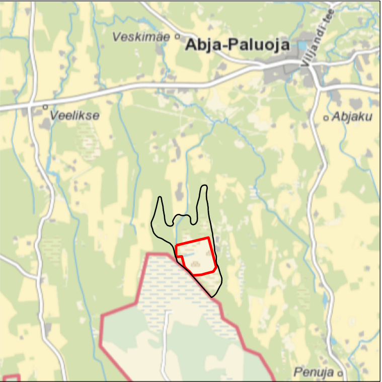
Kaardileht nr 532 Karksi